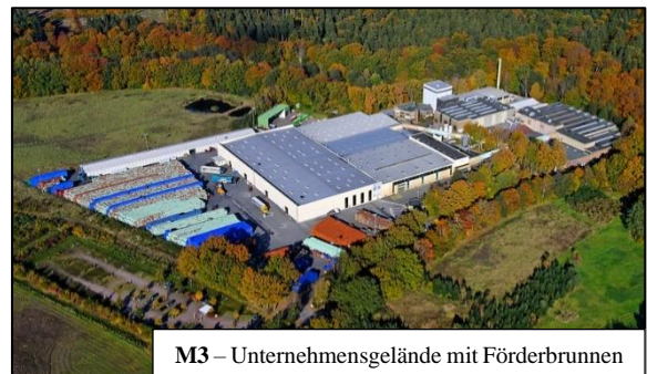
M3 – Unternehmensgelände mit Förderbrunnen

Die offizielle Quelleneröffnung: Mit dem Beginn des Jahres 1906 wurde der Pachtvertrag und der Bau der notwendigen Gebäude beschlossen und das Quellwasser wurde abgefüllt.